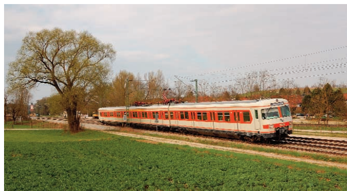
420 001 ist am 10. April 2010 bei Langenbach auf dem Weg nach Regensburg.