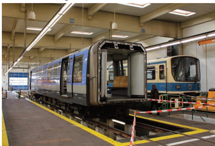
Blick in die Werkshalle der Technischen Basis in Fröttmaning.

Am 22.10.11 ergab sich für unseren Verein die Gelegenheit, sich zusammen mit den Münchner U-Bahnfreunden e.V. an einem Stand am Tag der offenen Tür in der Technischen Basis in Fröttmaning zu präsentieren. Unsere bewährte S-Bahn-Bildergalerie war ebenso mit von der Partie wie zahlreiche fleißige Helfer. Unter dem Motto „150 Jahre Mobilität für München“ nahmen neben der Technischen Basis auch Hauptwerkstätte und Betriebshof der Trambahn an den Feierlichkeiten teil. Das MVG Museum hatte seine Pforten mit kostenlosem Eintritt geöffnet und in der Innenstadt sorgte ein Trambahnkorso für Aufsehen. Über 40.000 Gäste nutzten die einmalige Gelegenheit zum Blick hinter die Kulissen.