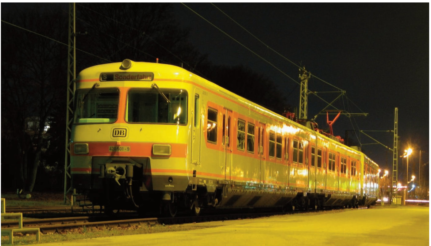
Zu Störstrom-Messfahrten war 420 001 im Dezember 2006 eingeteilt. Hier wartet er auf seine nächste Messfahrt im FTZ München-Freimann.