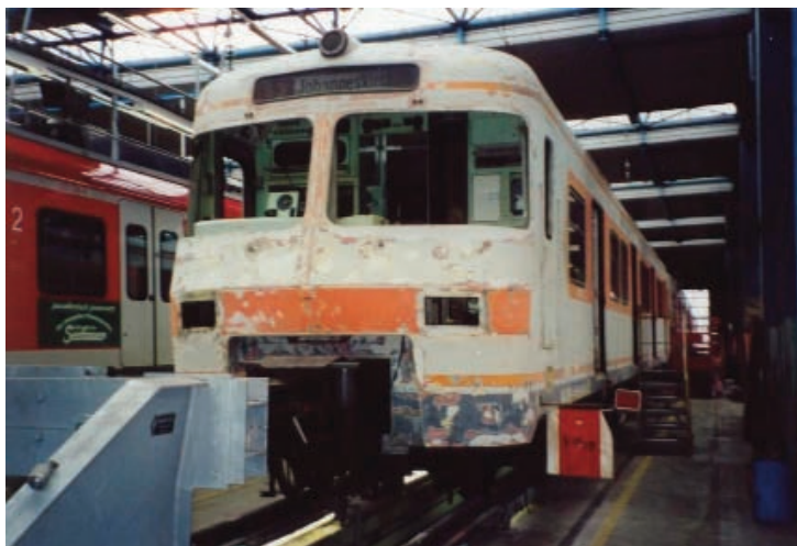
ET 420 001 bei seiner HU im Jahr 2002 im BW M-Steinhausen.

Nach über einem Jahr Abstellzeit im S-Bahn Betriebswerk München-Steinhausen ist der Museumszug ET 420 001 am 7. Oktober 2011 von der Münchner S-Bahn-Abschlepplok 203 002 nach Nürnberg in das dortige Ausbesserungswerk geschleppt worden. Dort erhält ET 420 001 nun eine komplette Hauptuntersuchung, bei der auch die in die Jahre gekommene Verkabelung erneuert wird.