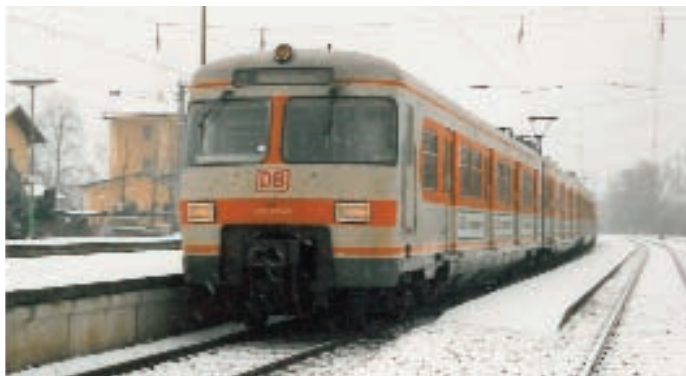
420 001 in Dachau

Nach langen Verhandlungen zwischen der S-Bahn München, der DB-Konzernzentrale und der Bayerischen Eisenbahngesellschaft (BEG) konnte die neue Hauptuntersuchung in "trockene Tücher" gebracht werden. Um die Kosten für die Untersuchung etwas hereinholen zu können, wird ET 420 001 neben Sonderfahrten auch wieder in den Plandienst zurückkehren. So soll er nach aktuellen Planungen ab dem Fahrplanwechsel im Dezember 2011 auf den Linien S20 und S27 verkehren und somit helfen, einen Zug der Baureihe 423 freizusetzen, der auf den restlichen Münchner S-Bahn Linien z.B. der S4 zur Verstärkung gebraucht wird. (gh)