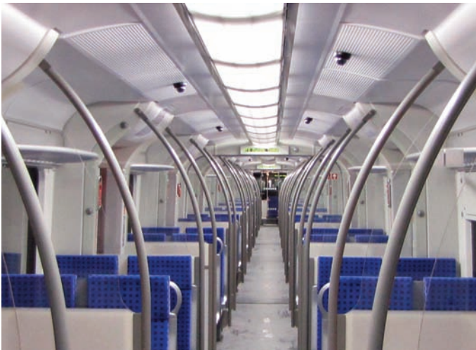
Videüberwachung im ET 423